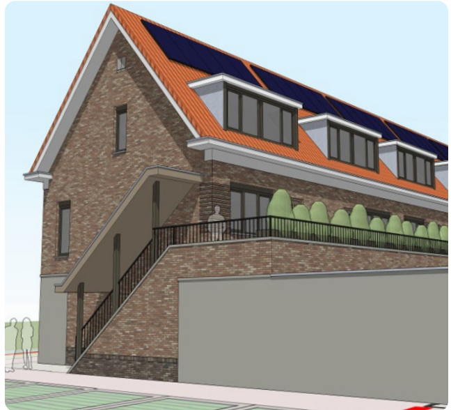
Impressies Buitenlust Noord